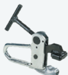
Morsetto per cerchi Alu Alloy rims clamp