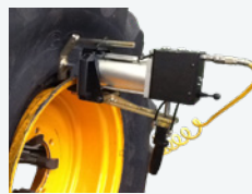
Premi tallone pneumatico Pneumatic bead pressing device