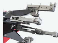
Adattatore per ruote EM e OTR EM and OTR wheels adapter