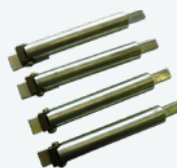
Juego de 4 extensiones de 42"-56" Conjunto de 4 extensões de 42"-56"