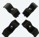
Juego de 4 protecciones para llantas de alu Conjunto de protetores de roda de alumínio