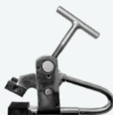
Pinza para llantas de aleación Grampo de roda de alumínio