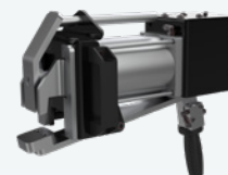
Dispositivo neumático de pensado Dispositivo de pressão no talão do pneu

Para más información, consulte el folleto completo - Para obter mais informações, consulte nosso folheto detalhado