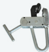
Pinza para llantas de aleación Grampo de roda de alumínio