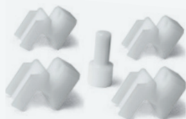
Juego de 4 protecciones para llantas de alu Conjunto de protetores de roda de alumínio