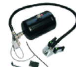
Sistema de inflado TI Sistema de inflação TI