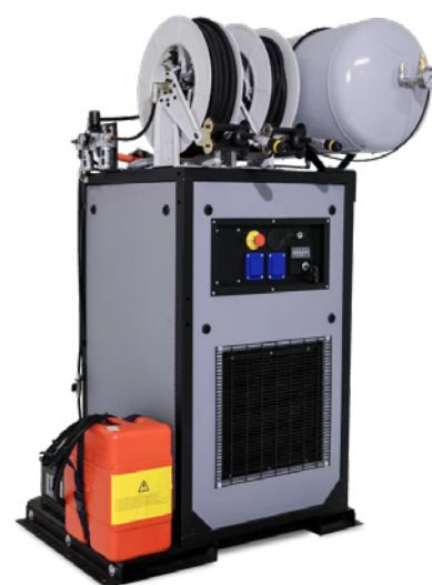
UNITA' GENERATORE PIÙ COMPRESSORE 36m 3 /h - 600 lt/min Pressione PSI: 12 bar