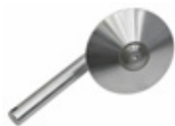
Disco stallonatore in acciaio