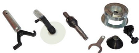
Kit per smontaggio ruote vettura