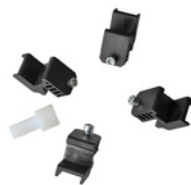
Leva + pinza per cerchi in lega + 4 protezioni per cerchi in alu