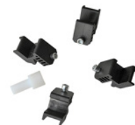
Set di 4 protezioni per cerchi in alu