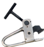
Pinza per cerchi in lega